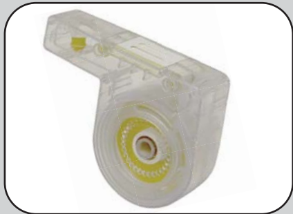
• 双面使用，同时降低内带成本 也兼顾环保