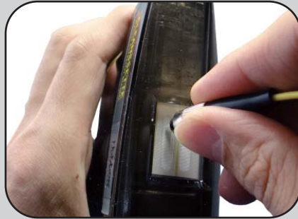
• 超极细緻清洁纤维能吸附各种脏污