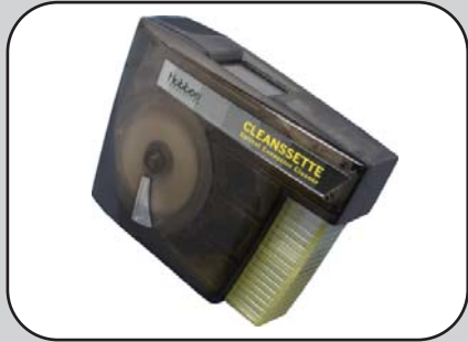
• CLEANSETTE-光纤连接器 卡带式清洁工具